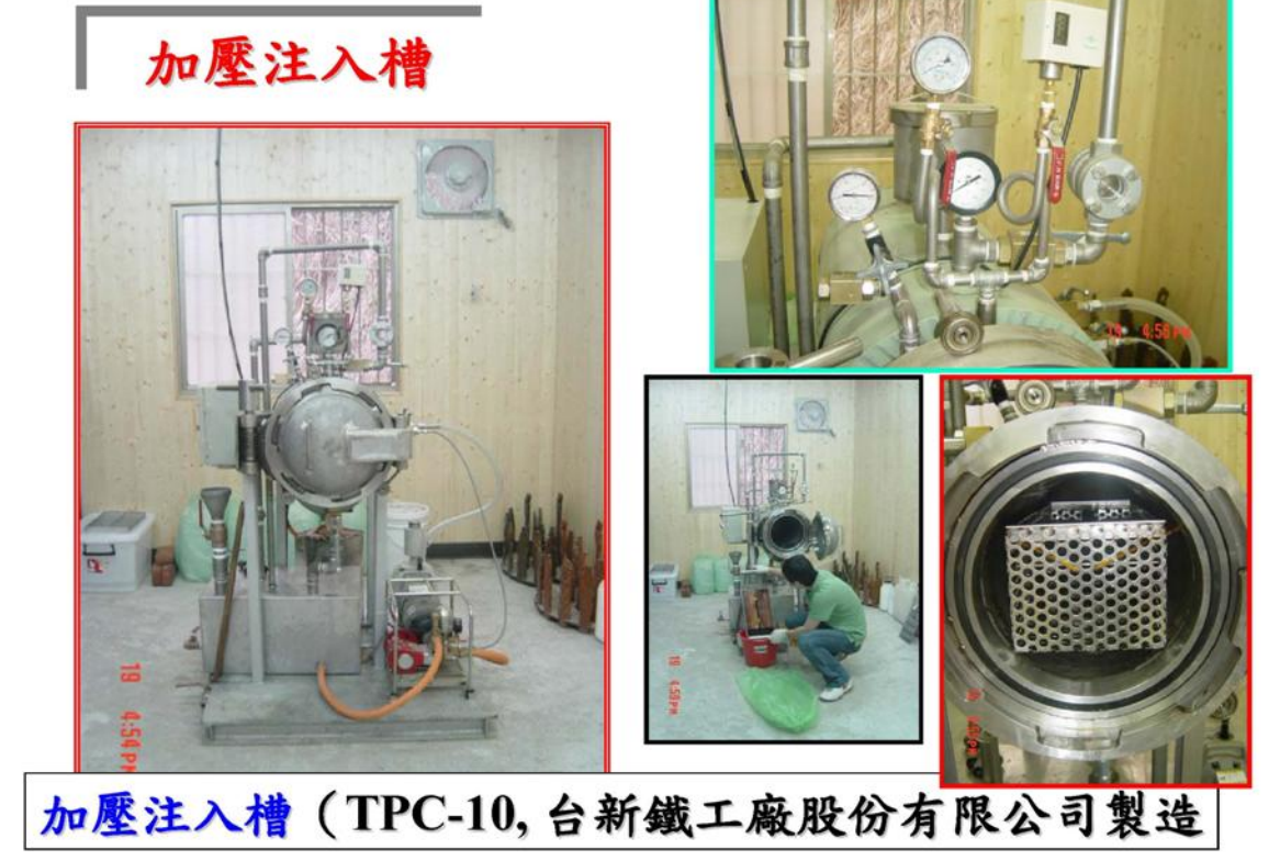
加壓注入槽 (TPC-10, 台新鐵工廠股份有限公司製造)