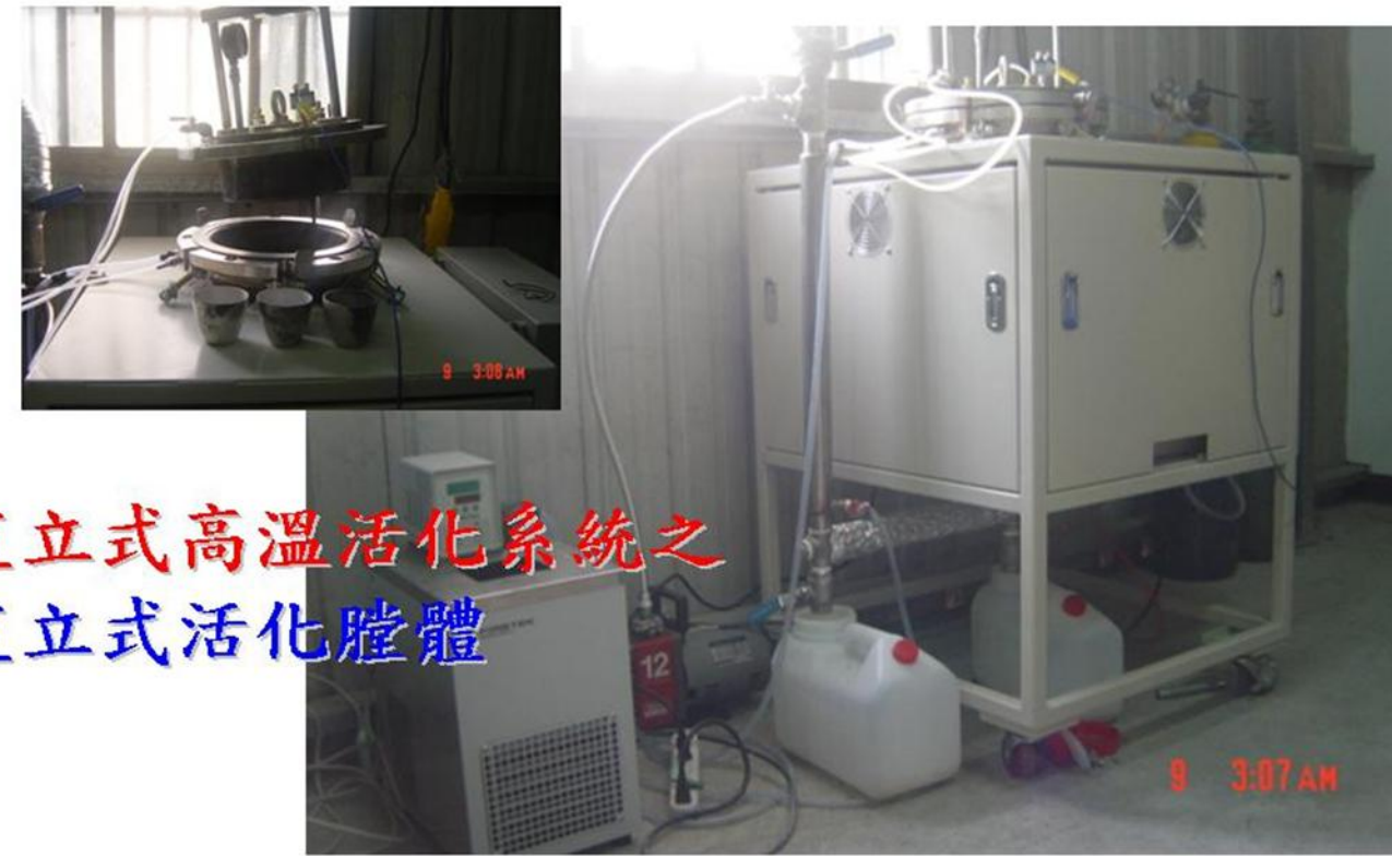
直立式高溫活化系統之直立式活化腔體